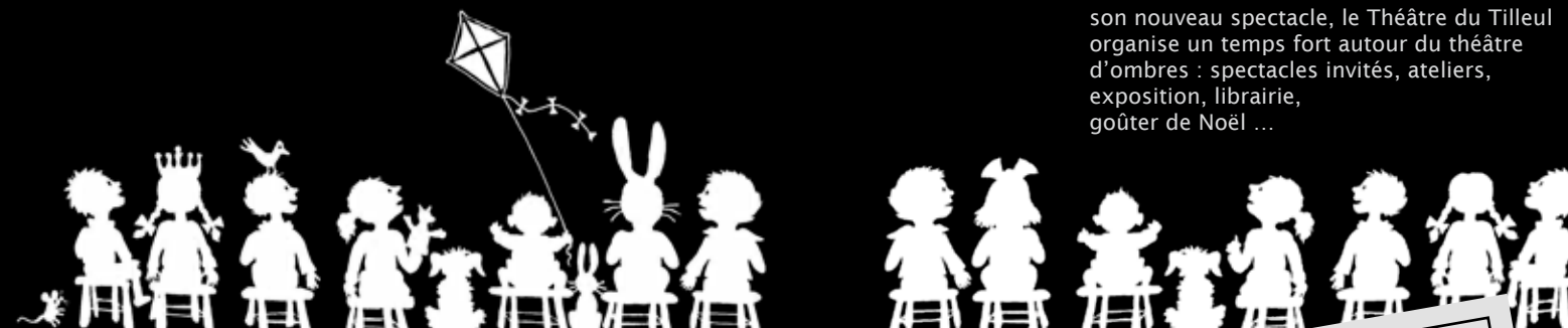
Jeux des 7 erreurs