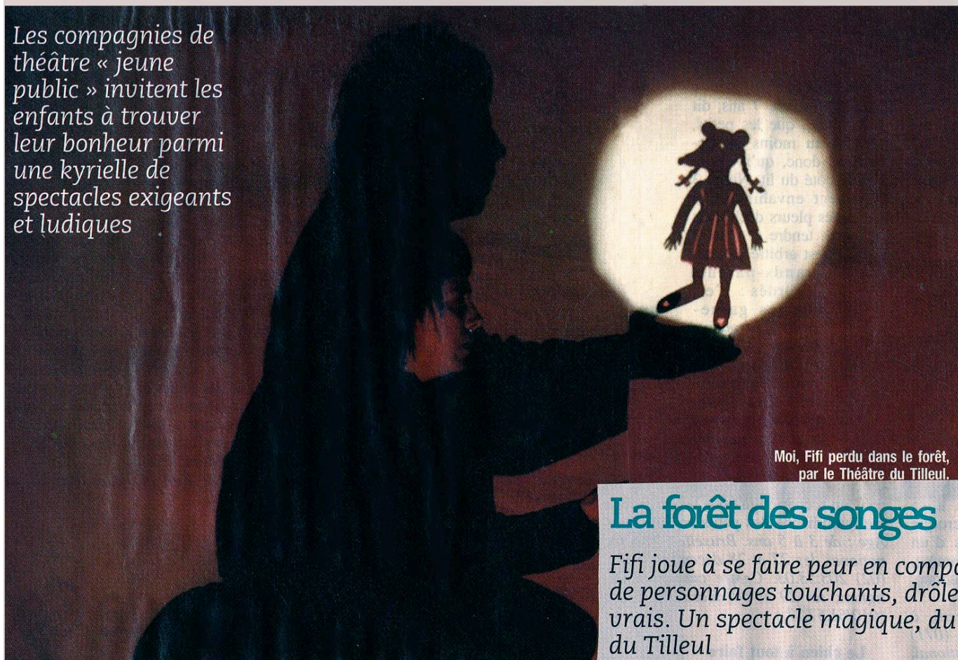
Moi, Fifi perdu dans le forêt, par le Théâtre du Tilleul.

Les compagnies de théâtre « jeune public » invitent les enfants à trouver leur bonheur parmi une kyrielle de spectacles exigeants et ludiques